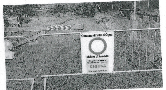
Villa d'Ogna: chiusa per smottamento la strada di via Cunella