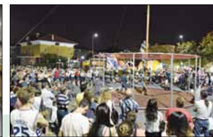
Grassobbio in Festa palo della cuccagna