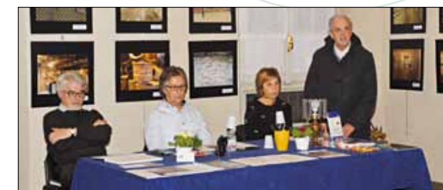
Inaugurazione mostra foto Roviezzo