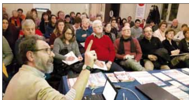
Incontro serata per la salute