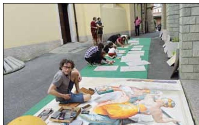
Grassobbio in festa: i Madonnari