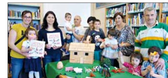
Fattoria delle mollette

biblioteca@grassobbio.eu - Vi aspettiamo!