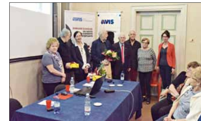
Incontro serata per la salute