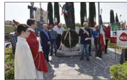
Ass. Naz. Combattenti e Reduci: 25 aprile