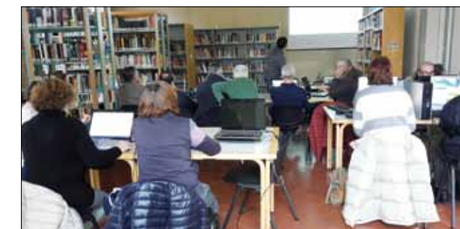
Corso informatica terza età