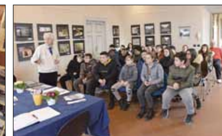
Mostra viaggio in Polonia