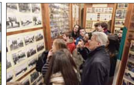
Museo dei ricordi