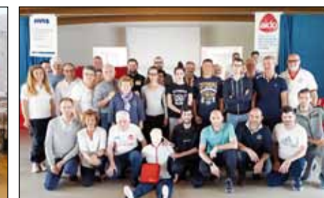
AIDO corsisti defibrillatori