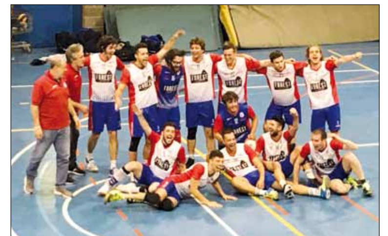
La squadra di Pallavolo qualificata in Serie B

e-mail: piervavassori@gmail.com www.volleygrassobbio.com