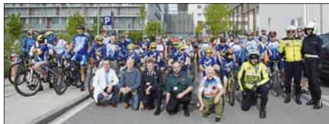
Pedaliamo per la vita