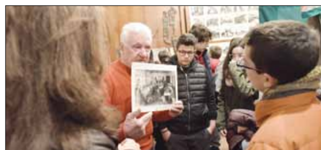
Le scuole al museo dei ricordi