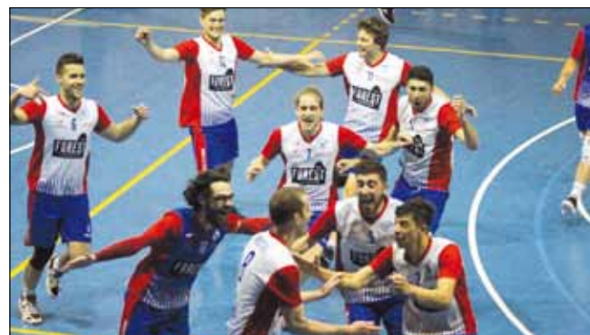
Esultanza della POG per il passaggio alla serie B