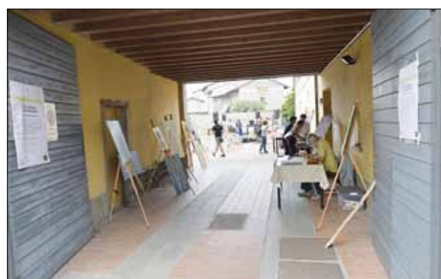
Grassobbio in Festa Cascina Ghezzi