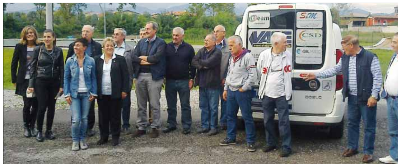
Volontari del servizio di trasporto socio-assistenziale