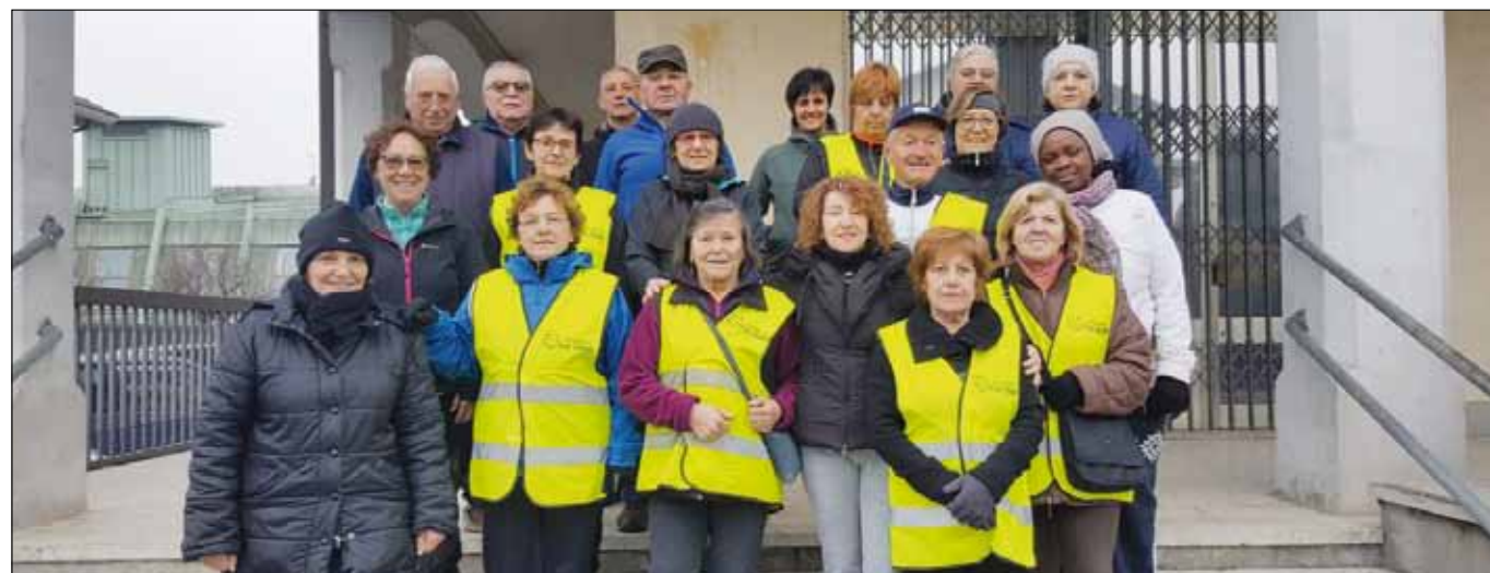
Gruppo di cammino