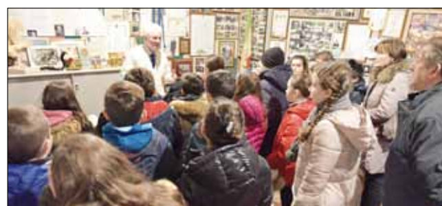
Visita museo ricordi