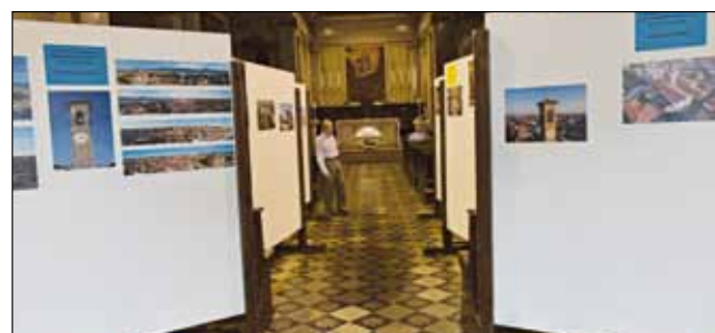
Grassobbio in festa: mostra in chiesa