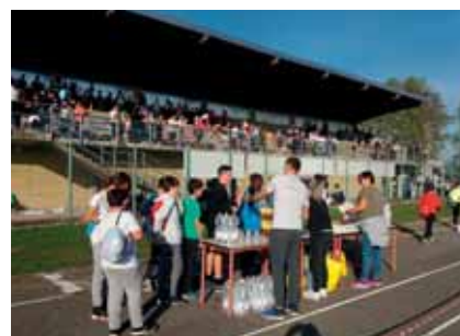
Alcune immagini della corsa campestre.

È doveroso ringraziare per entrambe le manifestazioni i docenti della Scuola Secondaria che hanno vigilato sugli alunni nell'arco della mattinata, l'Amministrazione Comunale per il tracciamento delle righe, l'Associazione FCD per la disponibilità del campo e il Comitato Genitori per il rinfresco offerto.