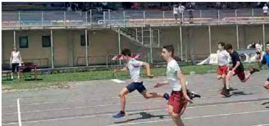
Alcune immagini della gara di velocità