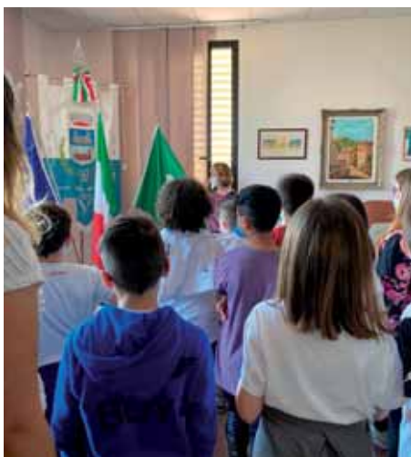
Gli alunni della scuola primaria incontrano la Giunta Comunale.

risparmio sono categorie imprescindibili per un territorio che voglia dirsi virtuoso. Per questo abbiamo pensato di intervenire nell'efficiamento di alcuni edifici. Impianti fotovoltaici sono stati posati sulla copertura della scuola secondaria a servizio della stessa, del palazzo municipale, e della palestra. Anche il Centro Diurno Anziani e il Centro Diurno Handicap sono stati dotati di impianti fotovoltaici.