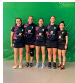
Serie A 2023