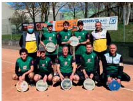
Serie D 2022