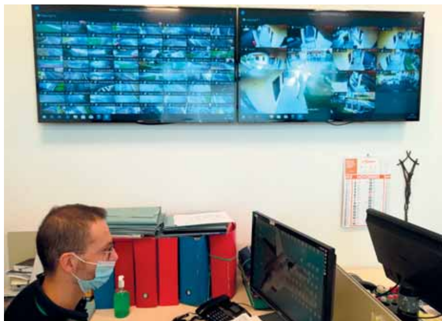
La nuova sala operativa.

Per quanto riguarda i controlli, la nostra Polizia Locale ha supportato il personale dell'Arma dei Carabinieri e la Polizia di Stato, per i controlli lungo la zona del Parco del Serio. Detti accertamenti venivano effettuati con il supporto dell'elicottero e delle unità cinofile.