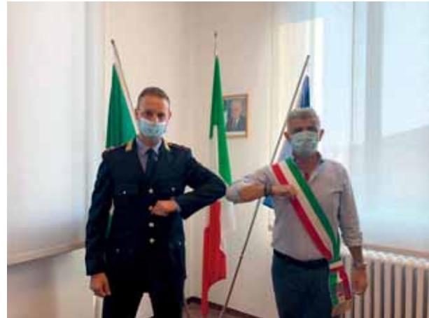
Il Sindaco con il nuovo Comandante.

Infine un ingegnere gestionale è stato collocato nell'ufficio