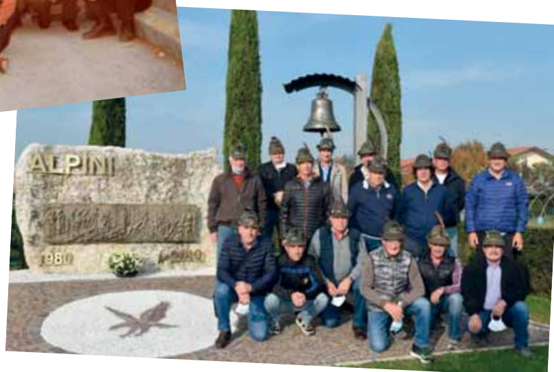
Gruppo Alpini 2020.