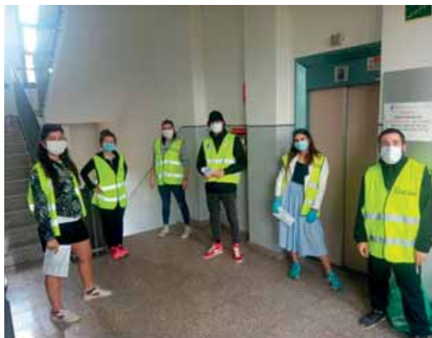
I volontari dell'Oratorio.

La collaborazione con Bianalisi era in scadenza il 30.06.2020; dopo le opportune verifiche e consultazioni abbiamo firmato una convenzione fino al 31.12.2021 apportando alcune migliorie richieste anche dalla popolazione come il "pagamento tramite bancomat".