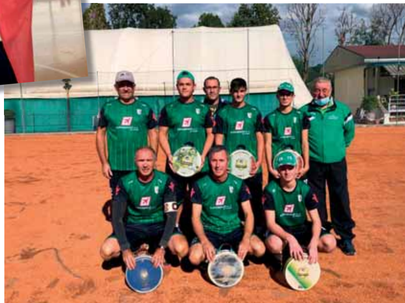
La squadra di Serie D.