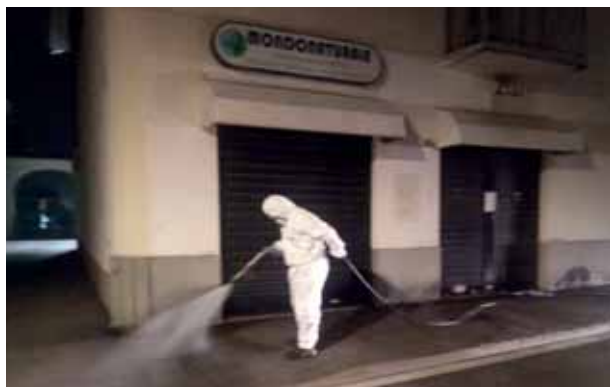
Sanificazione in via Roma.