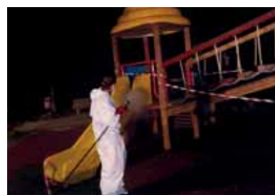
Sanificazione del Parco Giochi.

Continuare l'intervento di sostegno per i bambini diversamente abili nelle scuole, compresa la scuola materna, (seppure non previsto dall'obbligo di legge).