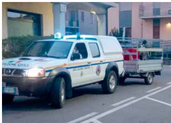
Auto della Protezione Civile.