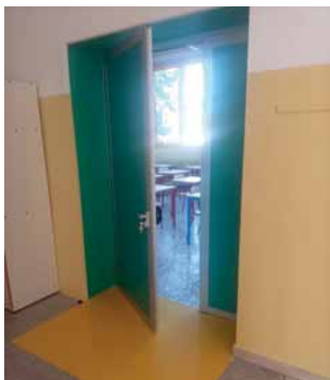
Rifacimento porte alla Scuola Primaria.

Sono state effettuate delle giornate di educazione ambientale per bambini in collaborazione con il Parco del Serio.