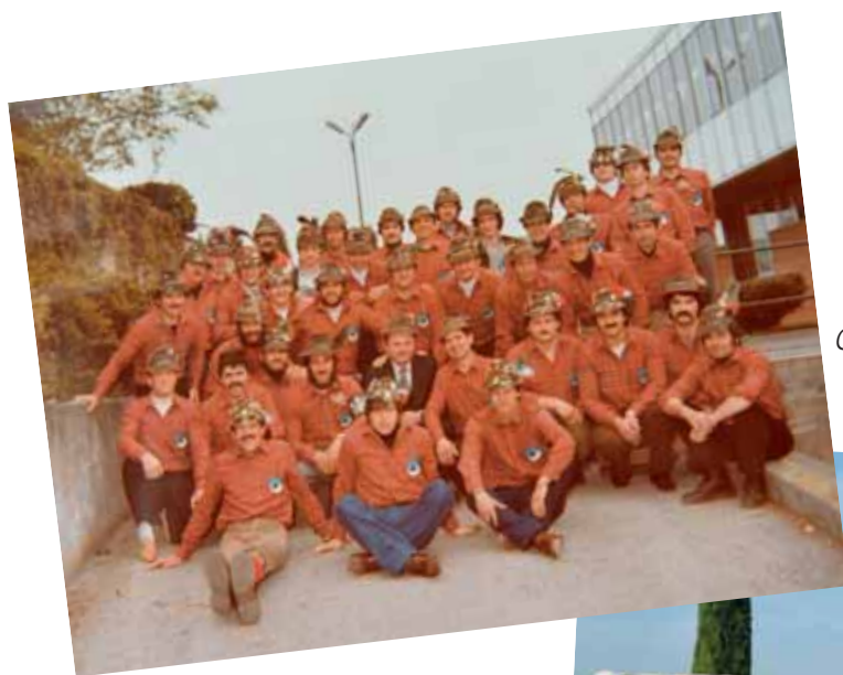
Gruppo Alpini 1980.