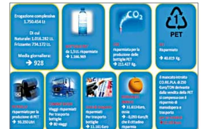
La casa dell'acqua di Grassobbio: Periodo di osservazione: dal 16 luglio 2011 (data inaugurazione) al 13 settembre 2016.

Per tutte queste "buone ragioni" l'Amministrazione sta considerando l'installazione di una seconda casa dell'acqua.