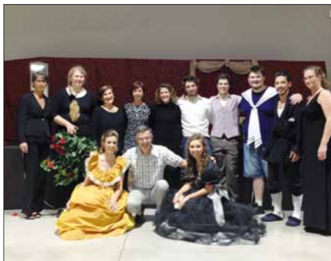
"Opera Buffa" dell'1 ottobre.

Contatta l'Ufficio Cultura (035/3843481) o la biblioteca comunale (035/526500), organizzeremo dei corsi di cui tu sarai il tutorial.