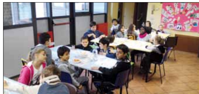
Al Giocascuola si pranza insieme...

Per gli studenti, oltre alle attività in essere (giocascuola, spazio compiti, trasporto scolastico, assegni di merito per gli alunni della scuole superiori, buono libri per gli studenti meritevoli della scuola secondaria 1° grado classi terze, progetti finanziati con il piano diritto allo studio) sono previsti: