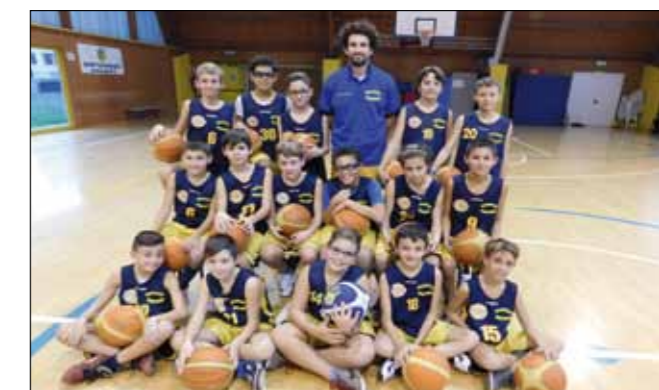
"Campionato FIP - squadra esordienti"