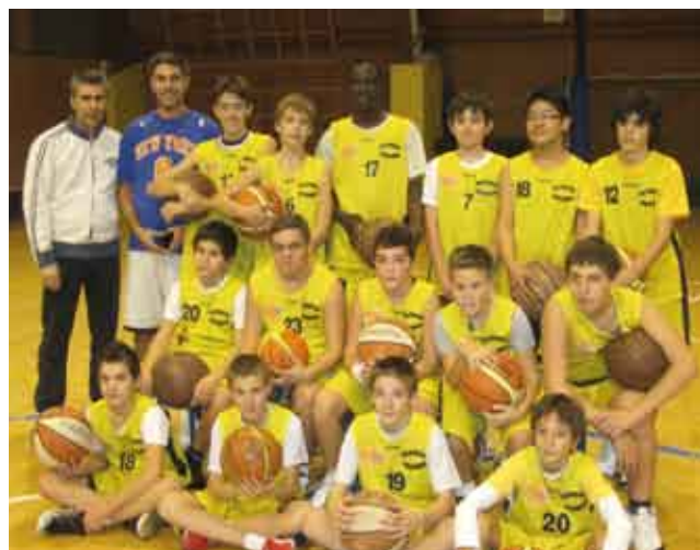
Basket under 14, anno 2011-2012