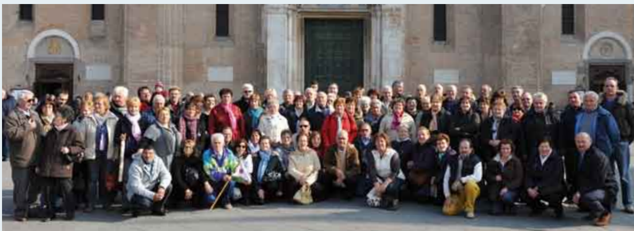
Volontari della Festa d'Estate in gita a Padova il 01/11/2011

Cogliamo l'occasione per augurare per le imminenti feste il Buon Natale e Buon Anno alla cittadinanza riconoscenti della loro presenza alla festa che ci sprona ad impegnarci anche nel 2012.