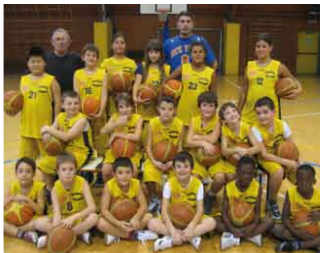
Minibasket, anno 2011-2012