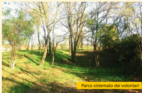
Parco sistemato dai volontari

CI AUGURIAMO CHE IN FUTURO ALTRE ASSOCIAZIONI, GRUPPI E PRIVATI CITTADINI SI UNISANO A QUESTE INIZIATIVE.