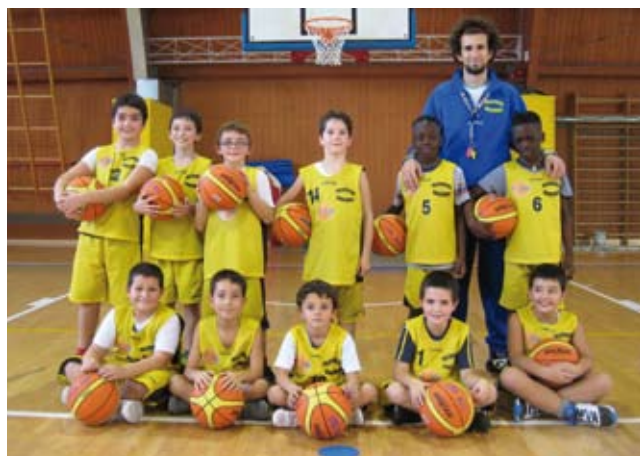
MINIBASKET UNDER 9 (MAGHETTI)