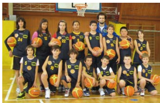
MINIBASKET UNDER 12 (MISTO ESPLORATORI)

Foto del gruppo Under 14 e Under 15. Questo gruppo partecipa al campionato provinciale della F.I.P. Lo scorso anno ha vinto il campionato provinciale CSI Under 14. Istruttore tecnico federale Domenico Silini.