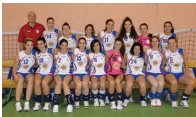
3 a ECCELLENZA

Stagione agonistica 2012/2013 al via e ci vede ancora impegnati su parecchi fronti ma prima di affrontarli con voi volevo cogliere l'occasione di ringraziare tutti coloro che ci hanno accompagnato nella passata stagione e che ci hanno fatto raggiungere ottimi risultati a partire dal settore giovanile che ha vinto il titolo provinciale csi e con le finali dell'under 14, un buon campionato di terza eccellenza femminile e una quasi promozione della seconda femminile, naturalmente, nonostante la retrocessione dalla serie C alla serie D, ringraziamo anche la prima squadra maschile. Naturalmente non dimentichiamo chi ci ha permesso di