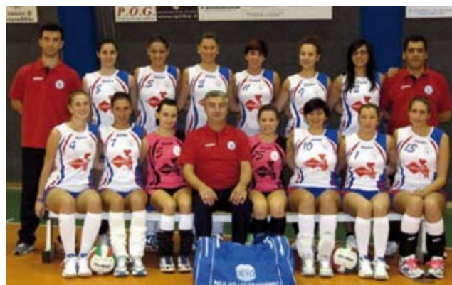
II a DIVISIONE

Vediamo adesso la programmazione di quest'anno che ci vede impegnati su vari fronti. Abbiamo la psicomotricità con i più piccoli per passare poi al minivolley dove cominciamo a costruire i campioni del futuro e dove ricordiamo c'è ancora posto per chi si volesse iscrivere, l'under 12 che porta avanti con tanta grinta il lavoro iniziato lo scorso anno,