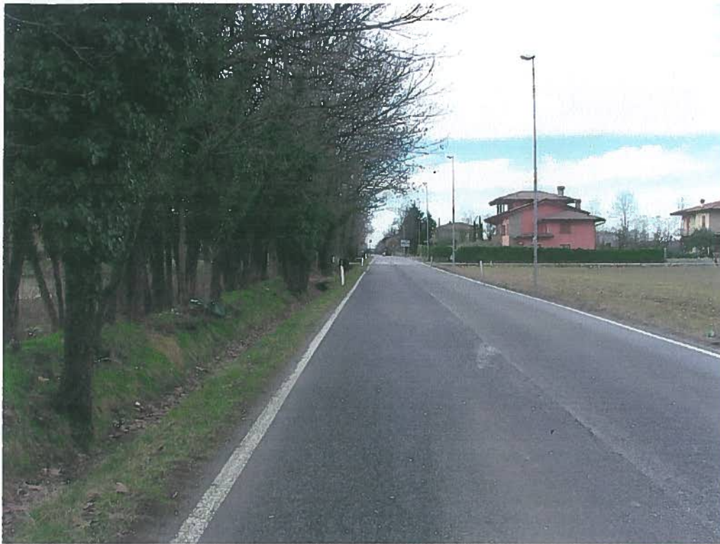
Fotografia n° 1