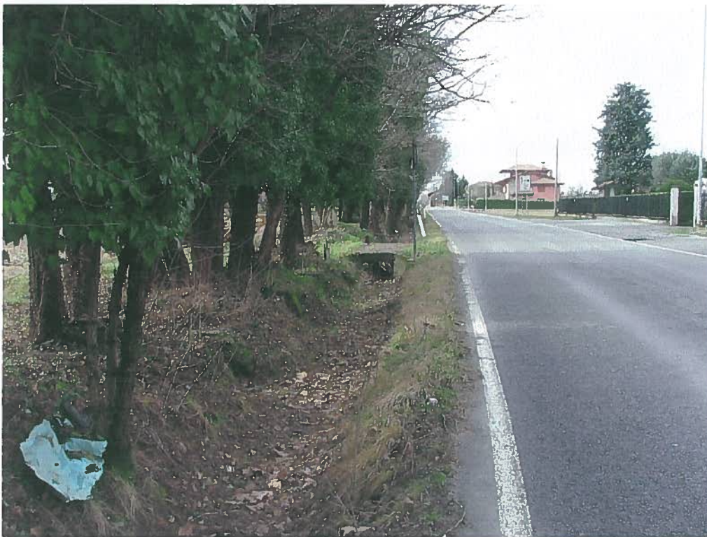
Fotografia n° 2