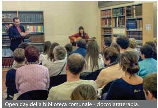
Open day della biblioteca comunale - cioccolaterapia.

Ecco spiegato il perché, in questi tre mesi, abbiamo cercato di rendere la nostra biblioteca piu' spaziosa, luminosa e accogliente. le postazioni computer da due sono diventate quattro ed è possibile utilizzare internet attraverso rete wi-fi in ogni sala, sino a due ore al giorno, per un massimo di sette ore a settimana. con i nuovi ordini sono arrivate anche due collane di audio-libri per coloro che hanno difficoltà nella lettura. sono state appese due bacheche sulle quali potrete affiggere avvisi vari (ripetizioni, baby bitter, badanti, ecc...) e per chi è in cerca di lavoro, una volta alla settimana, previo appuntamento, una persona sarà a vo-