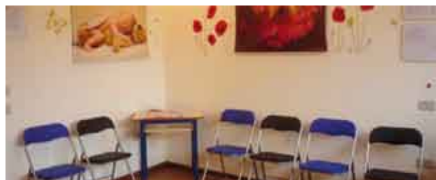
Immagine interna della Sede dell' Associazione.