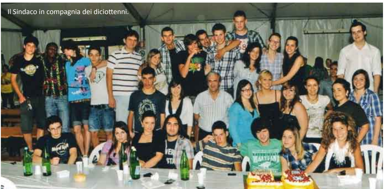
Il Sindaco in compagnia dei diciottenni.