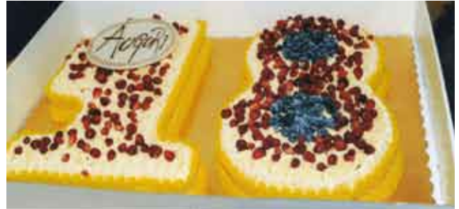
La torta offerta dall'Amministrazione Comunale ai ragazzi.

Il 25 Giugno, per l'inizio della Festa d'Estate 2010, è stata organizzata la "Serata dei 18enni", una festa dedicata a tutti i ragazzi del paese che durante quest'anno sono diventati o diventeranno maggiorenni. La serata, voluta particolarmente dal Sindaco Epis Ermenegildo, è stata pensata per mettere questi ragazzi al centro dell'attenzione dei cittadini. Come infatti ha ricordato il Sindaco "diventare maggiorenni significa acquisire per la legge piena capacità di agire, avere cioè maggiori responsabilità in quanto si è diventati cittadini a tutti gli effetti, con diritti e doveri". L'Amministrazione comunale, grazie all'aiuto offerto dalle Associazioni organizzatrici della Festa d'Estate (Alpini, P.O.G., Avis, Aido e Gruppo Giovani), ha proposto ai ragazzi una serata speciale offrendo loro cena, torta e spumante. A seguire, è stato proiettato un breve filmato riguardante i fatti storici avvenuti nel 1992, il loro anno di nascita e per finire, spettacolo dal vivo con i MEDICINA CROW che ha coinvolto il pubblico con musica rock e pop italiana, facendo cover di cantanti famosi come Vasco Rossi, Ligabue, Zucchero e tanti altri. L'Amministrazione ringrazia le Associazioni ed i volontari delle cucine e del bar per la riuscita di questa splendida serata sperando di riproporla anche per gli anni prossimi.