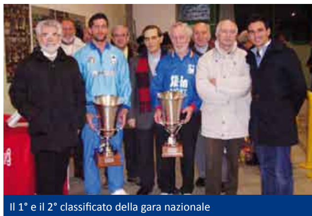
Il 1° e il 2° classificato della gara nazionale