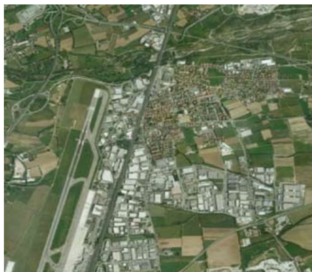
2010 - 6250 abitanti