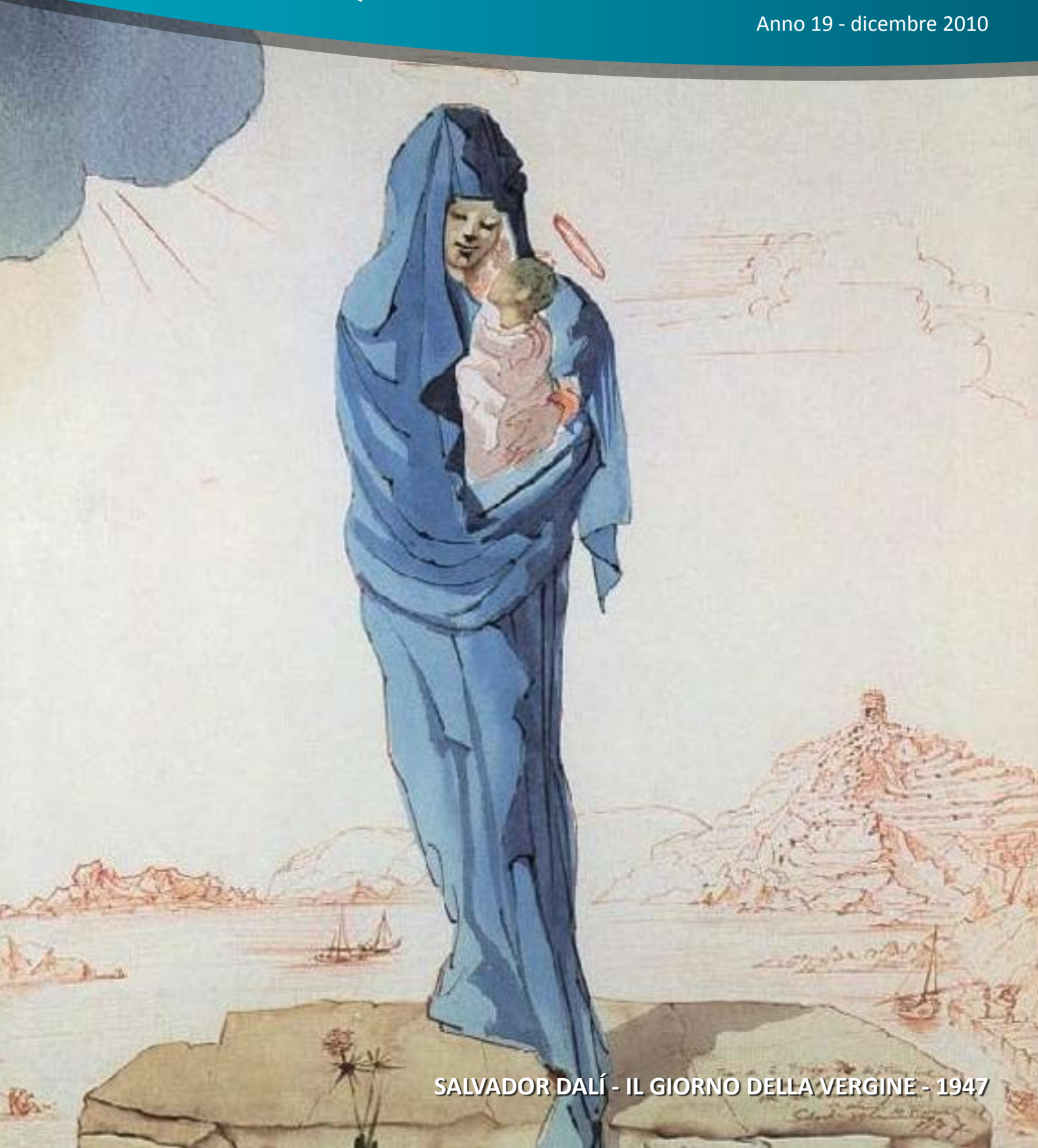
SALVADOR DALÍ - IL GIORNO DELLA VERGINE - 1947