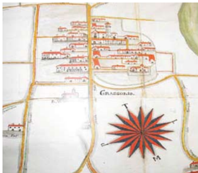
1804 - 700 abitanti