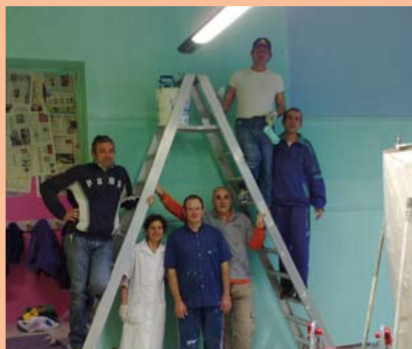
I genitori-pittori degli alunni della classe 5 A E